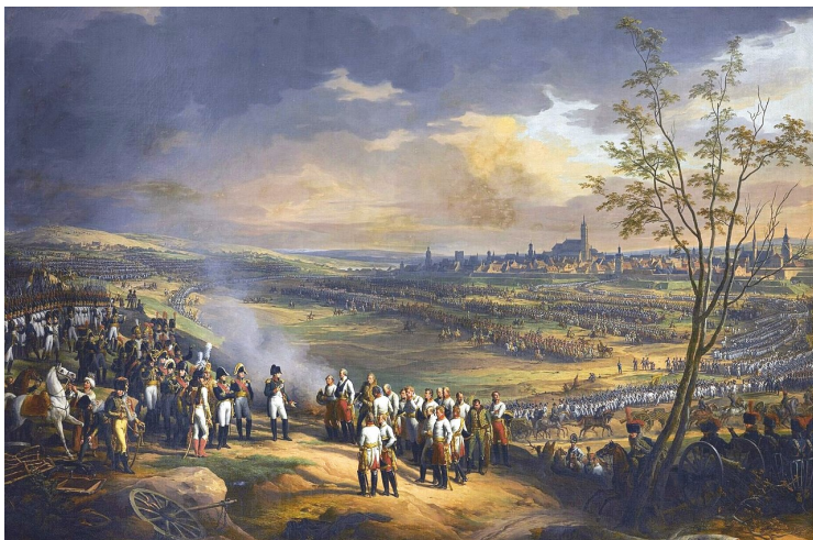
Шарль Тевенен, «Капитуляция Ульма 20 октября 1805» г.

Нового Света (XVI век), и разразившаяся Тридцатилетняя война (1618-1648) повлекли за собой постепенный упадок Ульма. До того, как городские укрепления были усовершенствованы, в Ульме попеременно хозяйничали то баварские, то французские оккупанты. В последний раз город был взят баварскими войсками в 1702 году. В войнах, начавшихся после Французской революции, город поочередно занимали французские и австрийские силы, уничтожившие городские укрепления. Потеряв в 1803 году статус имперского города, Ульм вошёл в состав Баварии. В кампании 1805 года Наполеону удалось заманить сюда австрийскую армию генерала Макка и принудить его сдаться в