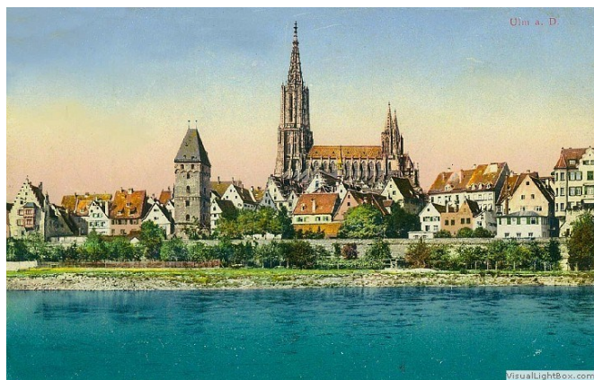
Ульм, 1900 г.

Изменения торговых путей, последовавшие за открытием