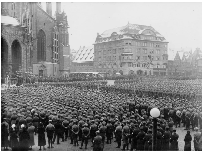
Ульм во время Второй мировой войны

В Ульме находятся исследовательские центры таких компаний, как Daimler Chrysler, Siemens и Nokia. Вокруг уни-