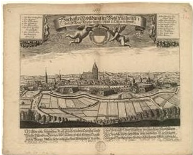
Ульм, 1640 г.